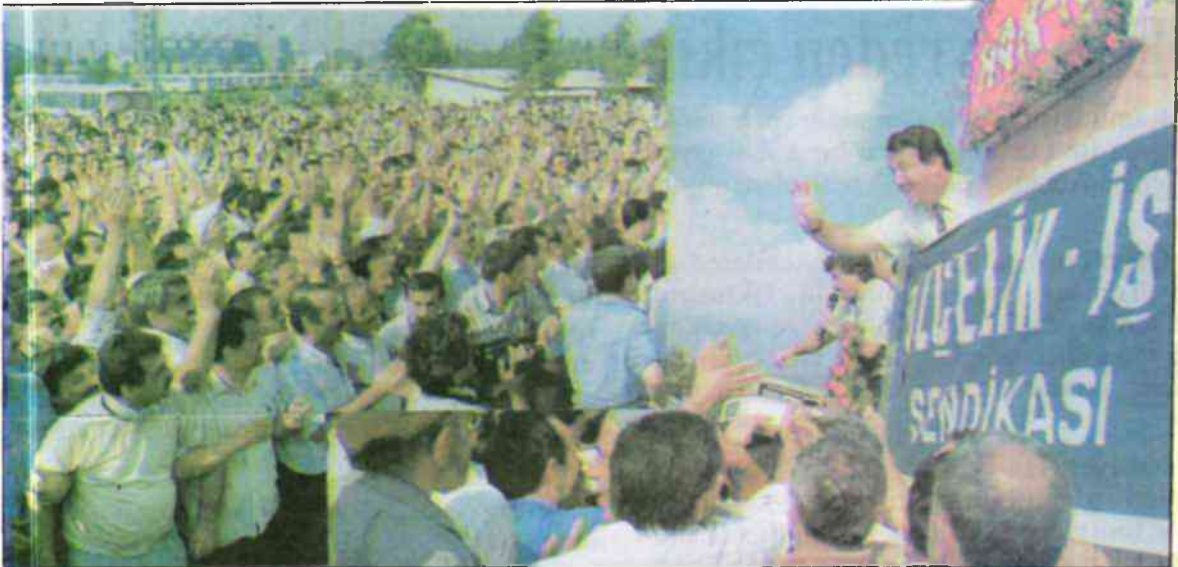
* Genel Başkanımız Necati Çelik İskenderun Mitinginde

lirtti. İşverenin tutumundaki haksızlığı kınadı. Devlete, millete, işçiye zarar olacak bu grevden geri dönülmesi gerektiğine işaret etti. Bunu yapacak tarafın da işveren olduğunu işçilerimizin kazanılmış haklarından ödün istememesi halinde konunun hemen çözülebilir olduğunu vurguladı. "Bu gece mesaideyim. Dilerlerse çözeriz. Biz haklarımızdan kesinlikle taviz vermeyeceğiz" mesajıyla işvereni diplomatik bir usulpla yeniden söz-