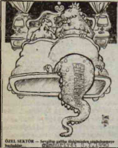
ÖZEL SEKTÖR — Seçilmiş çalısma rakamlarından enflasyonun hızıdır. ÇALIŞMA SAATİ VE ÜCRETİ

Teknik açıdan, enflasyon kelime olarak, 'şişme' anlamına gelir. Basitçe, fiyatların yükselip, şişmesi enflasyondur. Toplam arz, toplam talebi karşılamazsa, genel fiyatlar seviyesi yükselir, bu yükselme haline enflasyon denir. Sebepleri, maliyet ve talep enflasyonu adı altında ikiye ayrılarak incelenir. Maliyet enflasyonuna, mamul maliyetlerindeki yükselme neden olur. Örneğin işçi ücretleri sürekli yükseliyorsa, o ülkedeki genel fiyatlar seviyesi yükselebilir. Yani bazı uzmanlara göre işçinin ücreti arttıkça, enflasyon da artar.