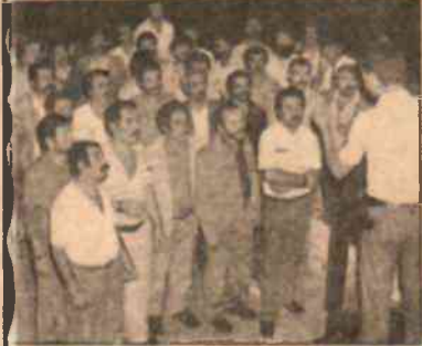
"Hakkını arayan 7 kişi hâlâ hapiste"

4 yıl Suudi Arabistan'da yol inşaatında çalışan 53 Türk işçisi ile Ürdün'de çalışan 35 Türk işçisi süründükten sonra beş parasız Türkiye'ye dönüyorlar