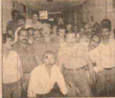
"Ürdün'deki işçiler hakkın tokluğuna çalışıyor"

Arabistan'daki Fahad el Zobin adlı şirketin yol inşaatında tarafların şartları altında çalışan 53 Türk işçisi. "Şirketin iflas