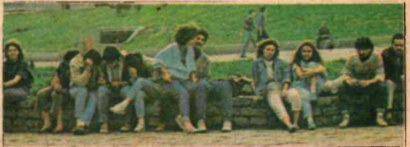
...Ve geleneklerimizden yoksun üniversite gençliği.

yapacak kişilerin temel eğitim bilgilerini alabilmesi, halkın dini ve misbet ilimlerde yetiştirilebilmesi, temini için eğitim ve öğretime, din hizmetlerine gerekli önem verilmiyor. Herkes kaderine terkedilmiş durumda. Pek tabii o zaman da başka unsurlar gençlerin ve halkın zihnini doldurmakta, meşgul