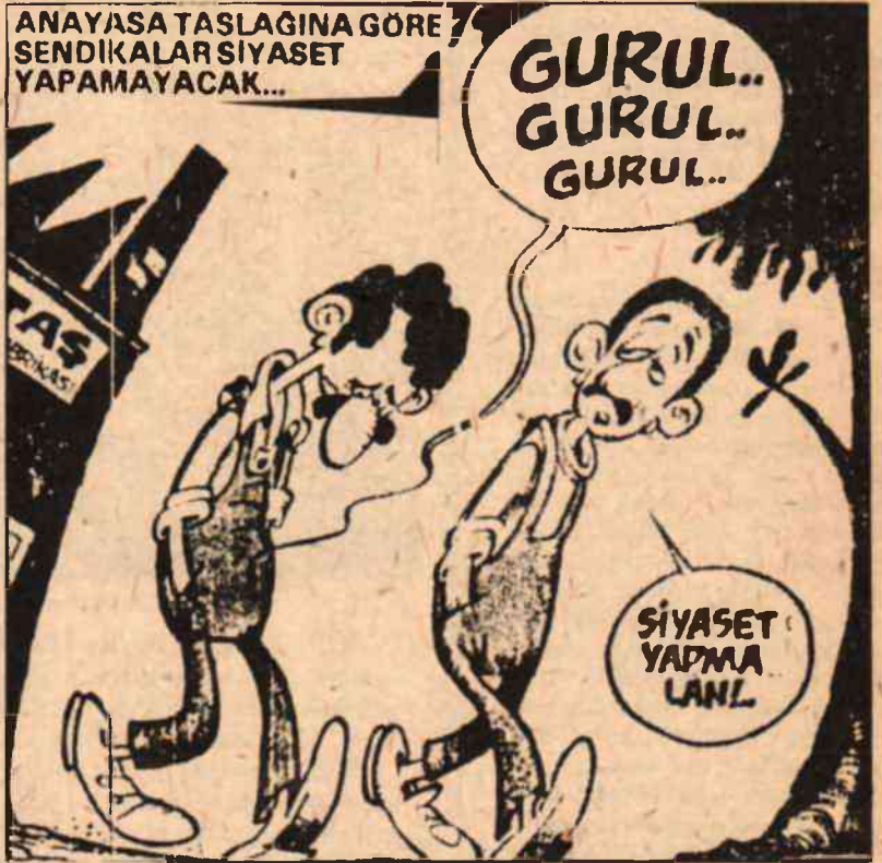
Gırgır Dergisinden alınmıştır.

Bir yalnızca ismini kullanır, ilgili olduğu kurumun, kuruluşun