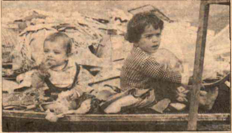
* Yıkılan evlerin enkazı üzerinde iki yavru.

- Vay benim emeklerim vay... Allah'ından bulasıcalar taşmısınız, taş..."