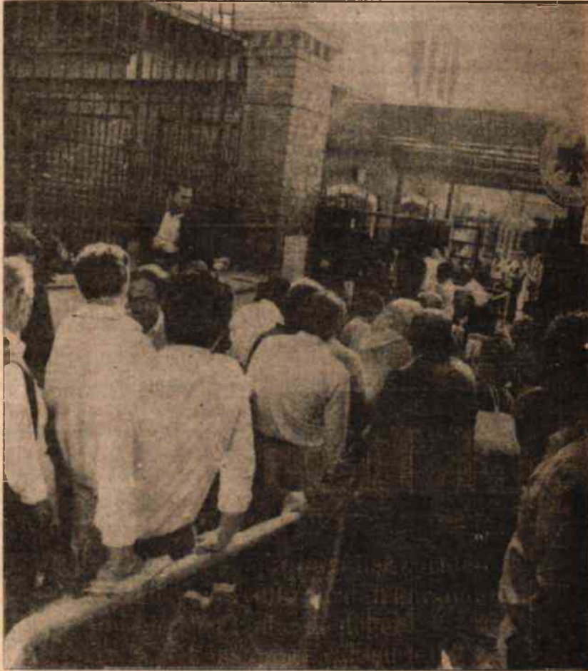
— Vize kuyruğu

ekonomik ve sosyal yönden yeterli faydayı sağladığını söylemek zordur. Politika yetersizliğinden, yurtdışında çalışırken ve yaşanırken karşılaşılan sorunlar, anavatanla olan ilişkiler, nihayet yurda tekrar geri dönüşte ortaya çıkan sorunlar adeta bir daire gibi halkaların her tarafında kendini ortaya koymuştur. Türkiye bu sorunlara değişik bakanlıkların birbir-