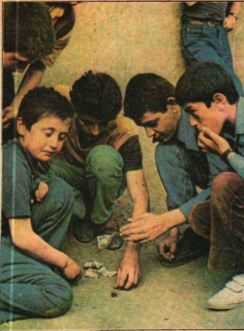
Bu çocukları sokaklar mı yetiştirecek? ....

ten üzerinde ayrı ayrı durmayı gerektiren çok önemli hususlara işaret edilmektedir.