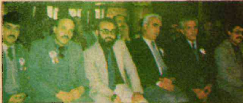
Genel Kurula katılanlardan bir grup