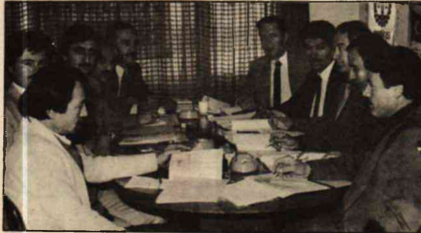
TOE işyerinde çalışan 800 işçi için Sözleşme müzakereleri devam ediyor.

ÖZDEMİR—İŞ Sendikası yetkililerinden alınan bilgiye göre, Sendikanın 2. Dönem T.İ.S. müzakereleri için taslak çalışmasının yapıldığını buna ilave olarak ta, işçi ile daha yakından ilgilenmek dert ve şikayetlerini dinlemek için yoğun bir işyeri ziyaretinde bulduklarını bildirdiler. Ayrıca Teşkilatlanma çalışmalarının da hızla devam ettiği bildirildi.