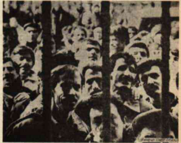
Bu solgun yüzlerin zoraki tebessümü, Tasarı'nın bu şekliyle yasallaşması halinde de devam edebilecek mi?

— Tazminatın vergilendirilmesi ile ilgili yeni hükümler getirilmiştir.