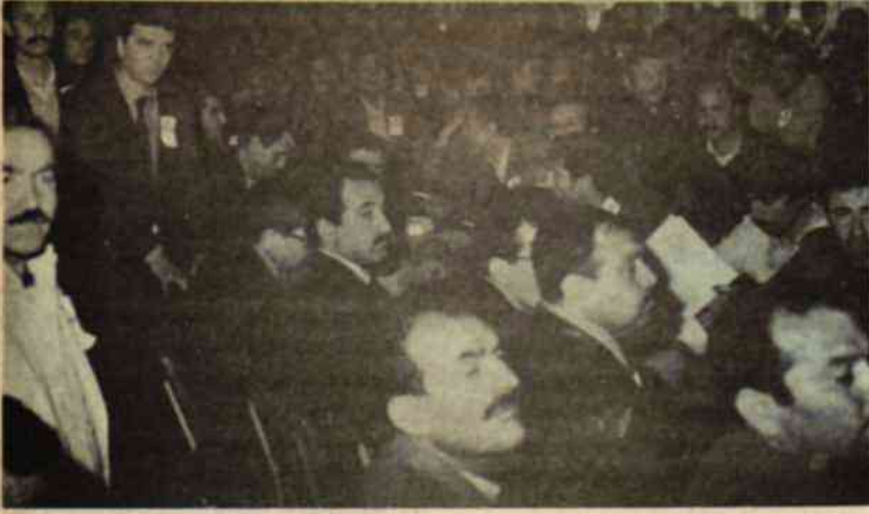
Genel Kuruldan bir görünüş.

tiği ve netice itibariyle iflas ettiği hususudur.